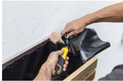
29. Die Überstände mit dem Cutter abschneiden.