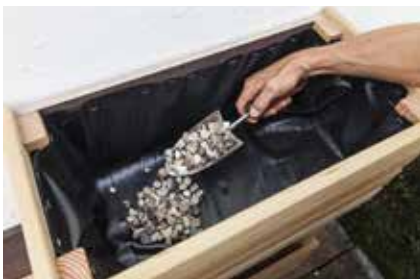
31. Eine Kies-Drainageschicht einfüllen, um Staunässe zu vermeiden.