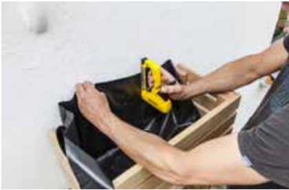
28. Die Kästen mit Teichfolie ausschlagen. Folie antackern.