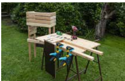
22. Nach bewährtem Prinzip die drei ersten Rhombusleisten links anschrauben. Die rechten Leisten dieses Moduls sind ja bereits an dem hohen Teil des Regals vorhanden.