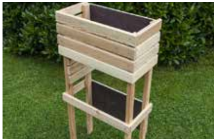
20. Das erste Element kann jetzt beiseite gestellt werden.