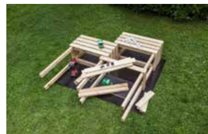
24. Nach demselben Prinzip entstehen jetzt alle weiteren Pflanzkästen.