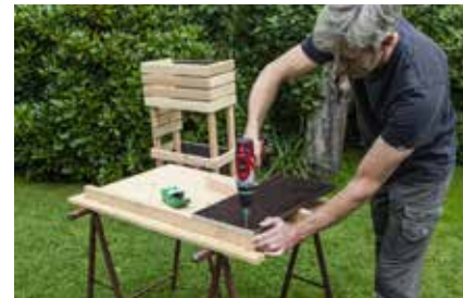
21. Das mittlere Element: Die Rückwand an die 842mm hohe Douglasienleiste schrauben.