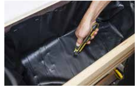
30. Die Folie über den Bohrungen für den Wasserablauf einschneiden.