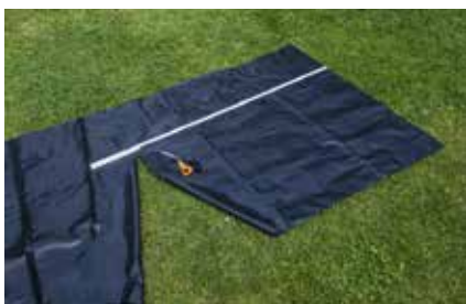
25. Die Kästen werden mit Teichfolie ausgeschlagen. Die Folie zuschneiden.