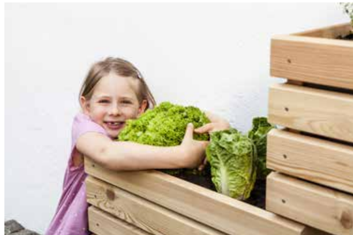
Jetzt nach Wunsch bepflanzen – und genießen!