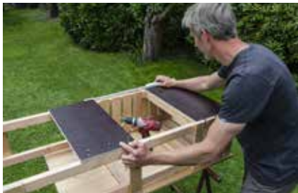
19. Abstände nochmals ausmessen.