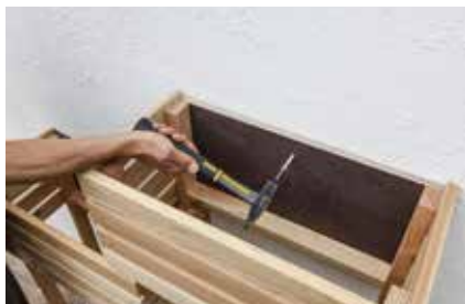
26. Damit das Regal sicher steht, wird es mit der Hauswand verübelt.