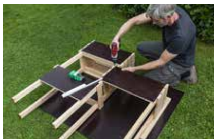
23. Die Rückwand dieses mittleren Moduls jetzt an das erste Regalmodul anschrauben.