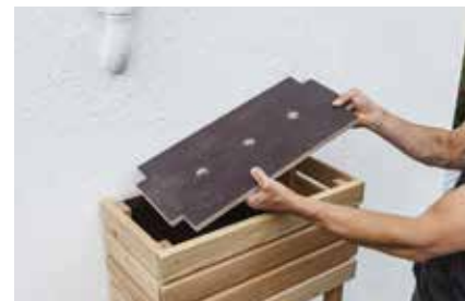
27. Die Böden einlegen.