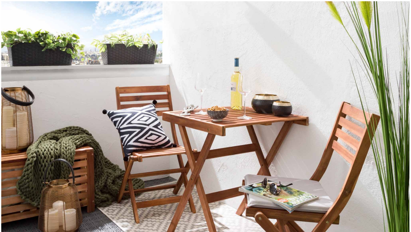
Konzeption und Fotos: home24

Nicht jeder Haushalt ist mit einem Garten oder großen Balkon gesegnet. Manchmal sind es nur wenige Quadratmeter, die zur Verfügung stehen. Doch selbst ein Mini-Balkon bietet wertvollen Extraplatz, der mit Kreativität und cleveren Ideen optimal genutzt werden kann. Steven Schneider, Chefeinrichter von home24, gibt praktische Tipps.