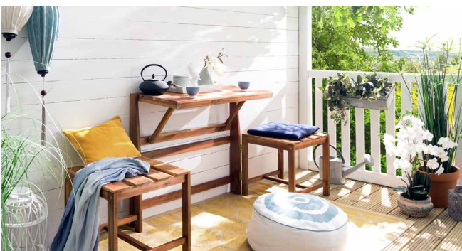
Praktisches Ensemble: Der Hängetisch lässt sich einfach hochklappen, die Hocker sind multifunktional als Beistelltisch oder Sitzgelegenheit verwendbar.