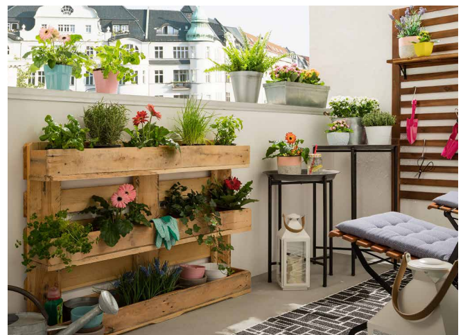
Mit einem selbst gebauten Palettenregal kann man selbst auf dem kleinsten Balkon Blumen, Kräuter oder Gemüse unterbringen.

wird, ist es auf Nordbalkonen stets schattig. Balkone im Osten eignen sich ideal für frühe Vögel, um die ersten Sonnenstrahlen zu begrüßen. Ein Westbalkon profitiert bis weit in die Abendstunden von der Wärme des Tages.