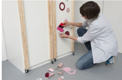
11. Zusätzlich verschönern Punkte und Ringe aus verschiedenen Folien die Front.