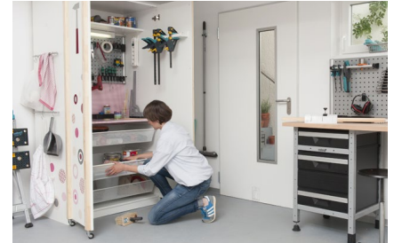
12. Ganz nach Bedarf können seitlich Griffe als Aufhängung angebracht werden. Auch ein Bord für Zwingen an der Türinnenseite ist praktisch.