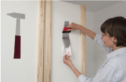
10. Das Aufkleben erfolgt ebenfalls mit der Rakel.