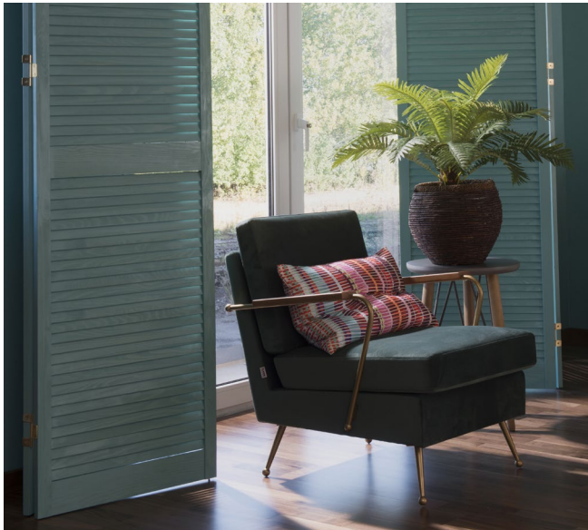
Konzeption und Fotos: Living Art