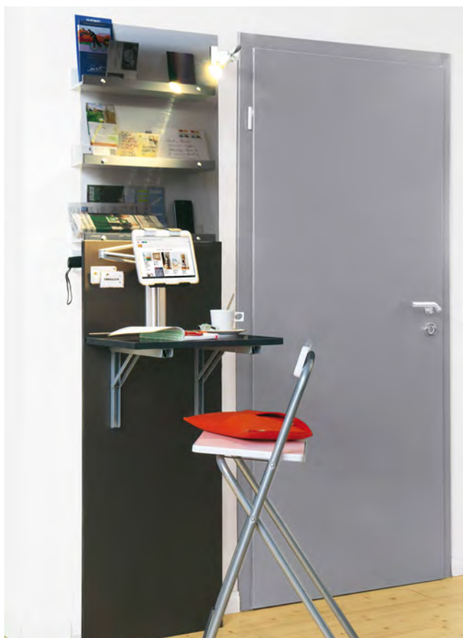
Konzeption und Fotos: Living Art