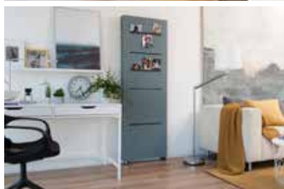
Die offenen Boxen sind aus vier Holzteilen gefertigt.