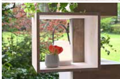
Konzeption und Fotos: Living Art