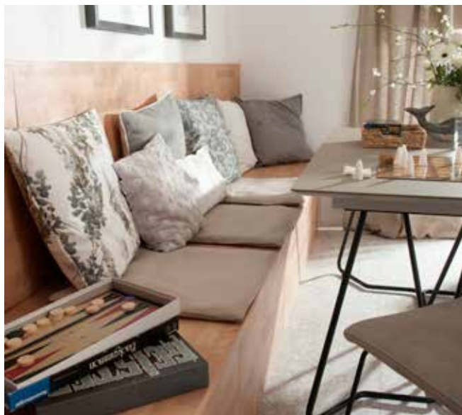
Konzeption und Fotos: Living Art