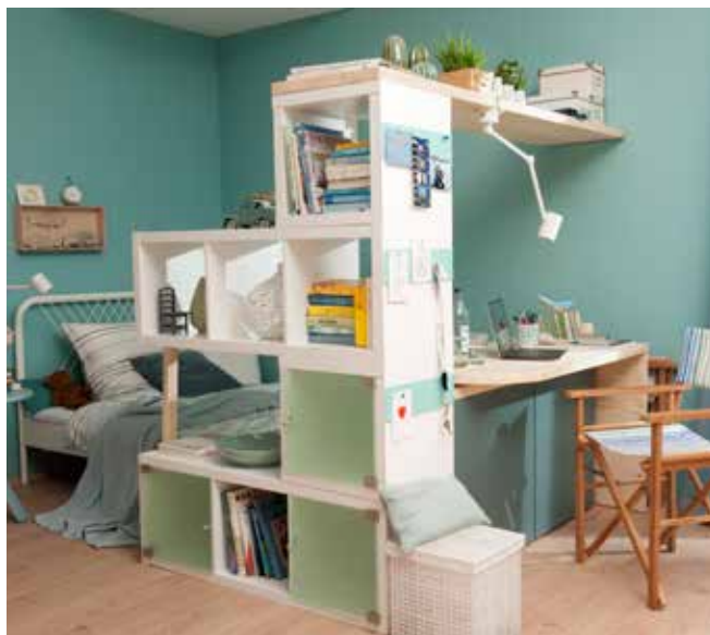
Konzeption und Fotos: Living Art