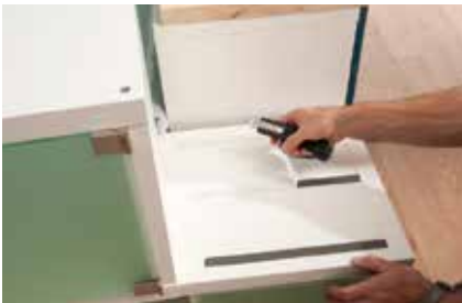
22. Die Schutzfolie vom Montageband abziehen und einen Regalwürfel auf das untere Regalelement kleben.