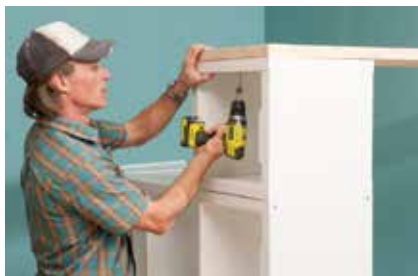
26. Das Brett mit Schrauben auf dem Turm und der Winkelleiste fixieren.