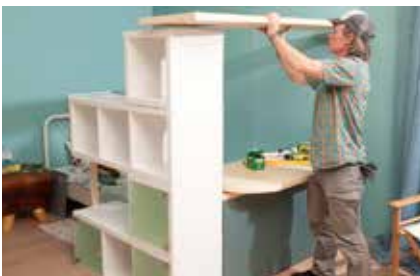
25. Regalbrett auflegen.