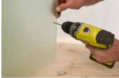
20. In Höhe des Magnetschnappers das Türblatt für den Griff durchbohren.