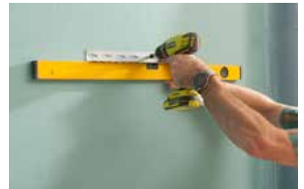
24. Das Ablagebord anbringen: Exakt waagrecht eine Metall-Winkelleiste an die Wand dübeln.