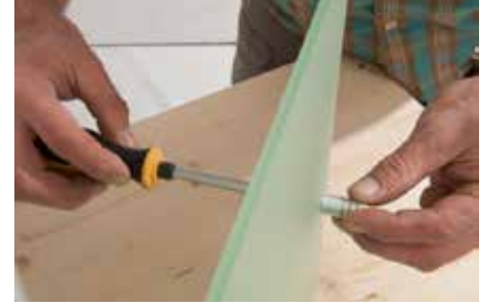
21. Den Edelstahlgriff anschrauben.