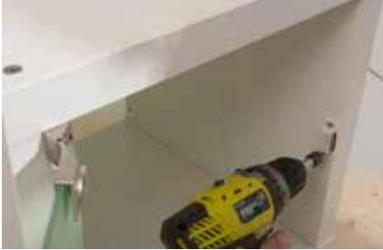
19. Als Anschlag für die Tür einen Magnetschnapper anschrauben.