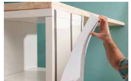
27. Als Pinnwand die mit dem Cutter zugeschnittene „Gutttagliss Hobbycolor“-Hartschaumplatte mit Montageband ankleben. Für die Optik haben wir zusätzlich hellblaue Filzstreifen über die Breite geklebt.