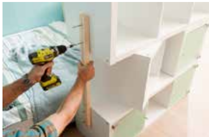
23. Das überstehende Regal erhält eine Leiste als zusätzliche Stütze. Sie kann wie hier an die Außenseite geschraubt werden. Die Alternative wäre eine passgenaue Stütze zwischen den Elementen.