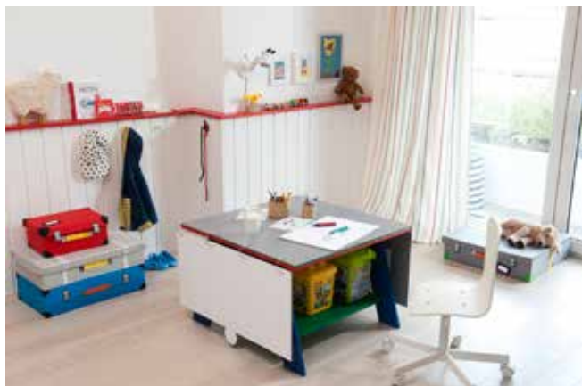
Produktion und Fotos: Living Art